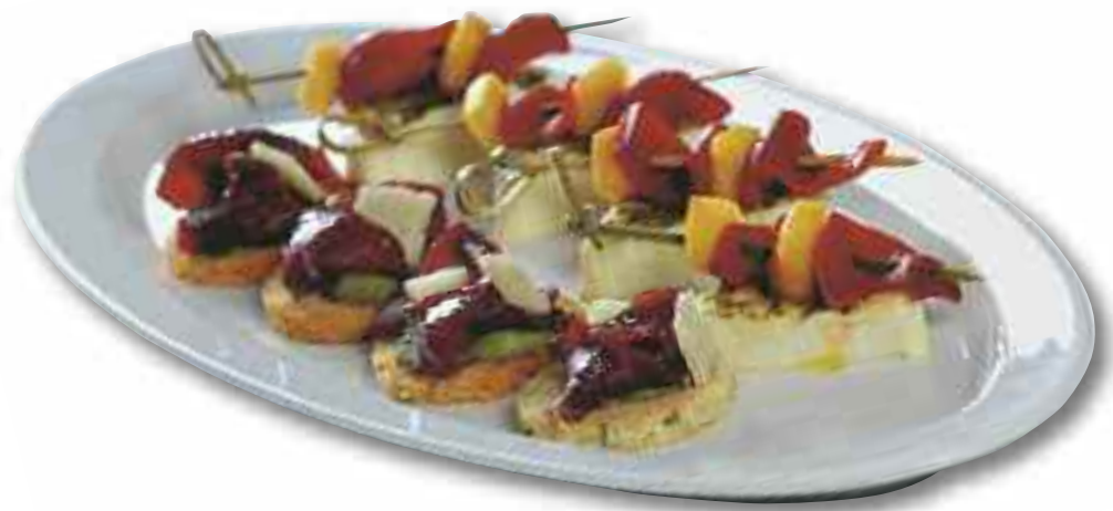
Mozzarellamousse mit Spiessli von geschmorten Peperoni und Mango an Pestosauce Parmesansable mit geräucherten Lammcarpaccio, Avacodocrème und Parmesan Möckli