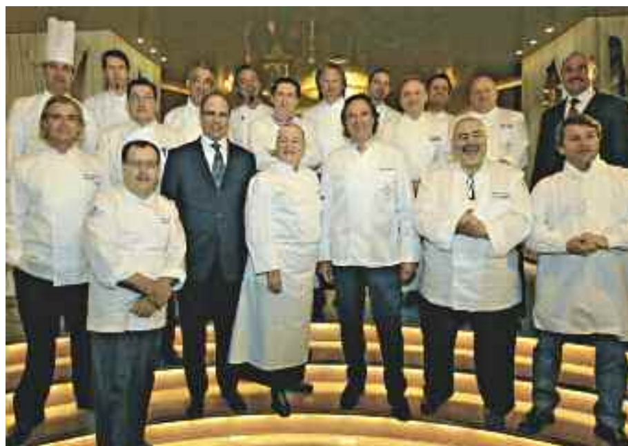
Die Direktion stellt die Gastköche vor: Der Grand Gourmet Opening Cocktail im Hotel Carlton bietet die Gelegenheit, die Köche kennenzulernen.